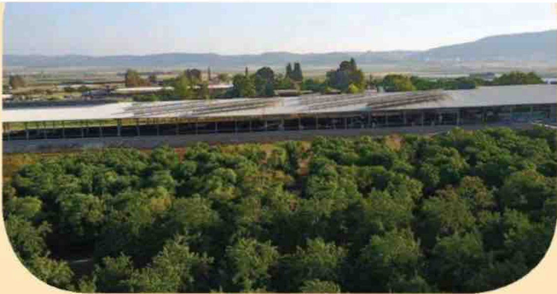
משק ליון מושב שדה יעקב

אם זכור לי, הגעתם למסקנות נחרצות? "בהחלט, אנחנו מדינת אי, תלויים בשני נמלים זהו, משם כל האוכל שלנו מגיע, אנחנו שותים את האוכל שלנו דרך שתי קשיות קטנות, האחת מחיפה ואחת מאשדוד זהו. מה שאנחנו באים ואומרים, שבמצב העניינים הזה ובהתחשב במצב האקלימי, המדינה חייבת להכין תוכנית אסטרטגית לביטחון המזון לעשור הבא. הוקם אגף לביטחון מזון במשרד החקלאות שהחל לעבוד בנושא זה, כולל היחס לחקלאות המקומית. וברגע שתהיה תוכנית ממשלתית שבה המדינה תדע כמויות, קרקע, מו"פ והיתכנות כלכלית, כאן נכנס החקלאי הישראלי. קודם כל צריך להבין כי החקלאות הוא הבסיס לתפיסת הביטחון של המדינה ולכן חייבים לשמור עליו".